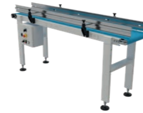
Nastri carico/scarico INOX

NT231A13 (400x1000) NT231A14 (400x2000) NT231A15 (400x3000)