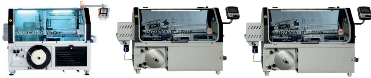
PRATIKA 56-T MPS - PRATIKA 56 MPE X1 - PRATIKA 56 MPE X2