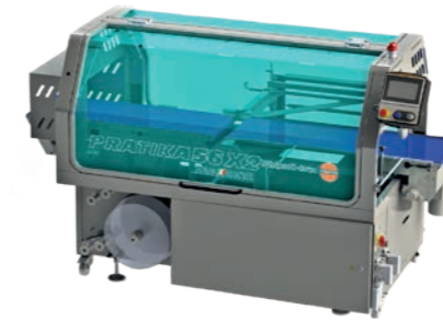
PRATIKA 56 MPE X2 INOX